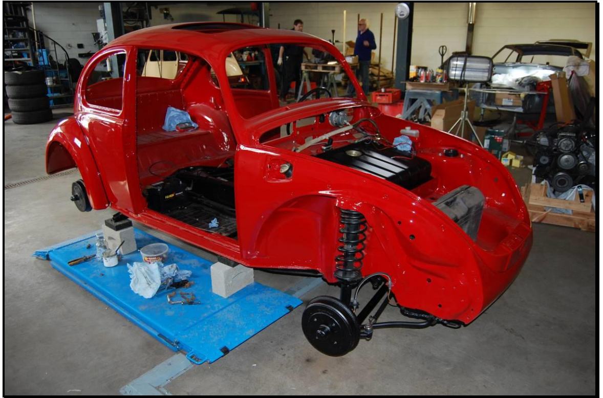
Die Frontpartie (Kofferraum) / la partie avant (coffre)