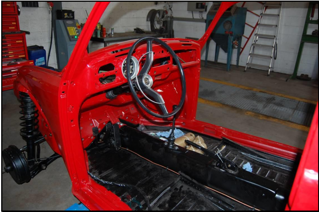
Das Fahrzeuginnere / l'intérieur de la voiture